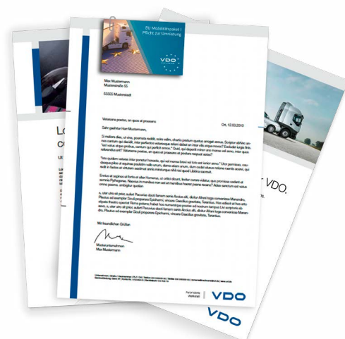
Business card flyer