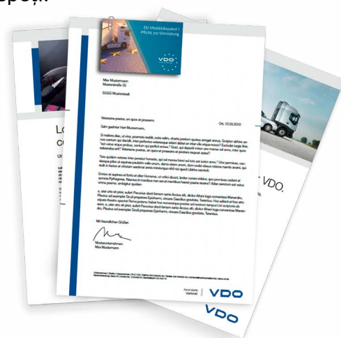
Business card flyer